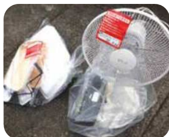
警告シールの貼られたごみ袋

正しく分別されていない場合は、伊賀南部クリーンセンターが警告シールを貼ります。その場合は、ごみを出した方が適切な形で後日、出し直しましょう。