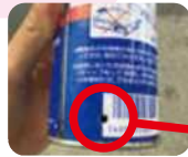
スプレー缶 穴あけ