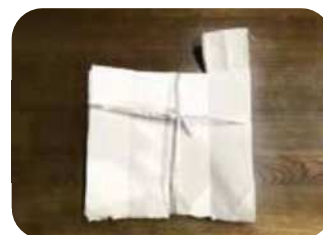
まとめて出してください