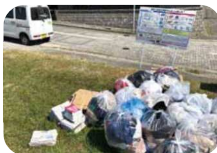
資源ステーションの様子

回収かごは設置していません。 通行の妨げにならないよう 整理して置いてください。