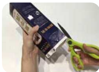
切り開いて乾かす