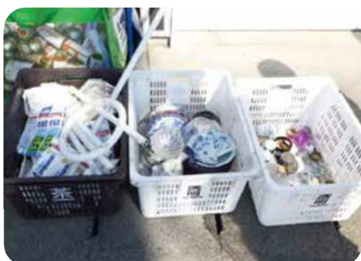
資源ステーションの不適正排出