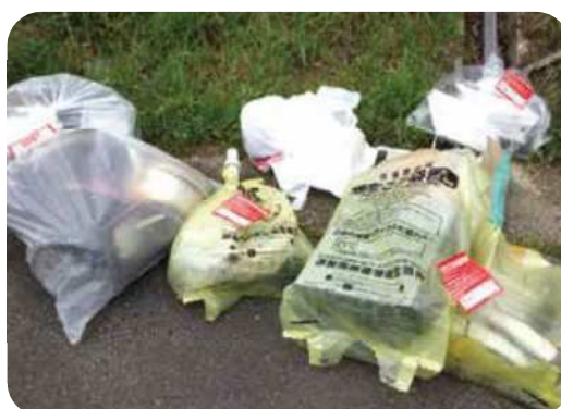
ごみステーションに残された 分別されていないごみ袋

正しく分別されていない場合は、伊賀南部クリーンセンターが警告シールを貼ります。その場合は、ごみを出した方が適切な形で後日、出し直しましょう。