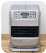
石油 ファンヒーター